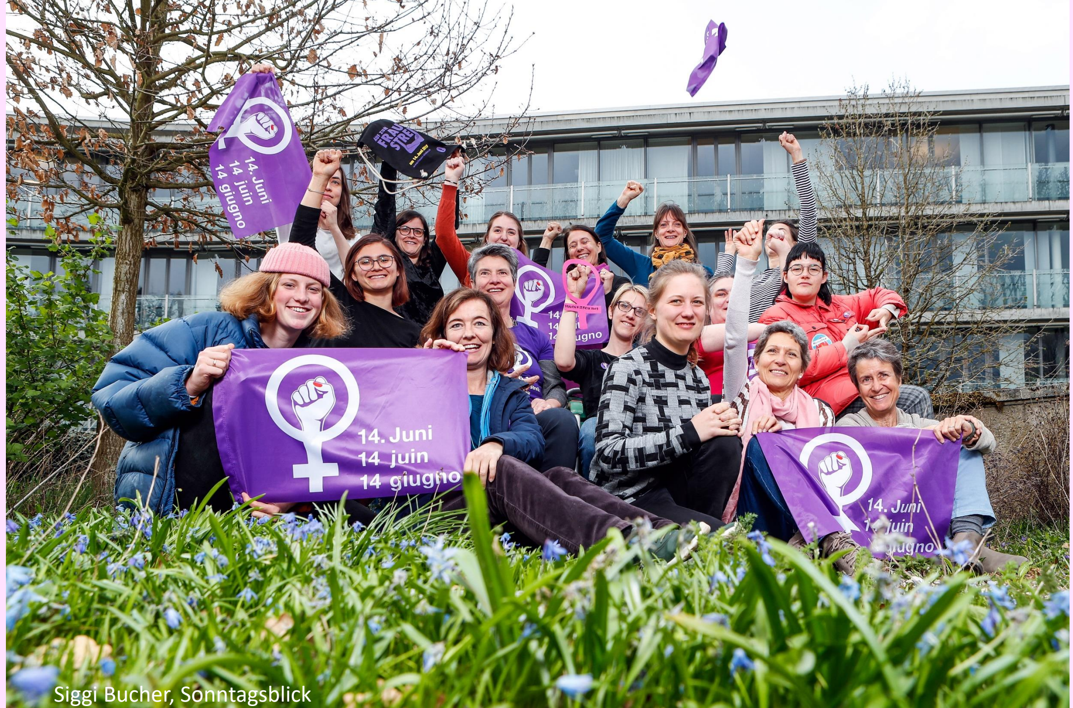
Siggi Bucher, Sonntagsblick